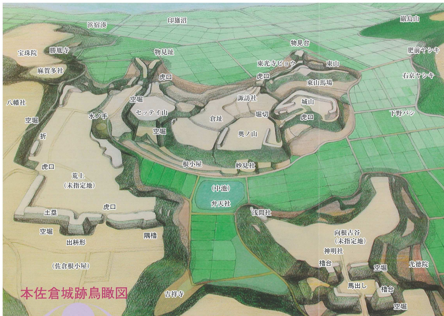
本佐倉城跡鳥瞰図