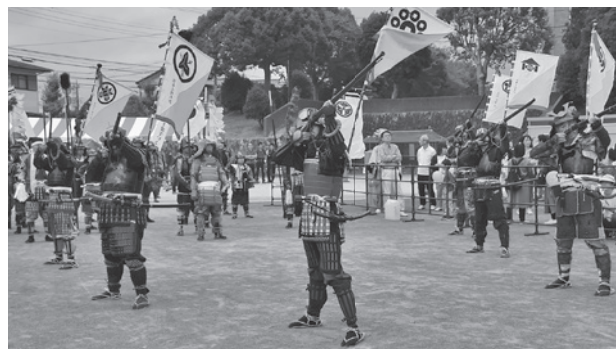
第4回酒々井・千葉氏まつりの川越藩火縄銃鉄砲隊演舞の様子

メインプログラム ○ばか乗り（仮装） 会場を仮装した人でいっぱいにして、大仮装大会だった昔の雰囲気を感じたいでしょう。 甲冑隊などによる、仮装行列も予定しています。 仮装して来場した方には記念品をプレゼントします。仮装していない方にも、仮装衣装のレンタルを予定しています。 ○競馬 会場内に、動物ふれあいコーナーを設置します。 ポニーや小動物などにエサやり体験や、記念撮影などができます。 ○ステージイベント 川越藩火縄銃鉄砲隊による発砲演舞や、チンドン芸能によるパフォーマンス、東京学館ダンス部によるダンスの披露などを予定しています。