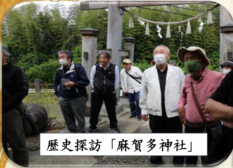
歴史探訪「麻賀多神社」