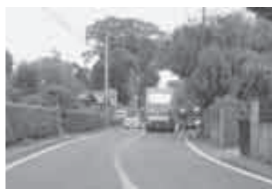
横町地先と下台地先を結ぶ町道

交通安全対策は、ガードレール・カーブミラー・道路反射鏡の新設補修等を主として行っています。