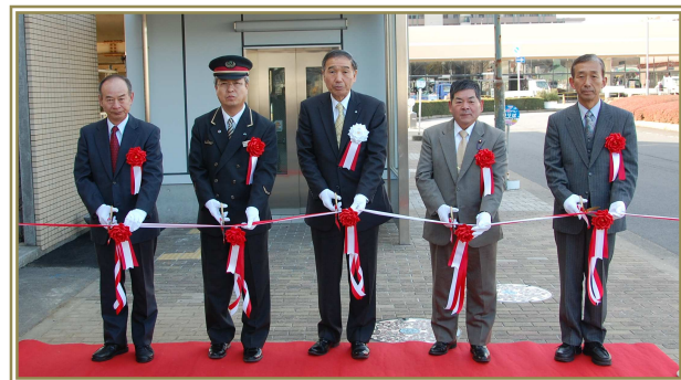
JR酒々井駅西口エレベーターが供用開始（2月2日）

駅の利便性の向上と高齢者や障害のある方などの移動に配慮するために進めてきましたJR酒々井駅及び京成酒々井駅の全てのエレベーターが完成しましたので報告します。