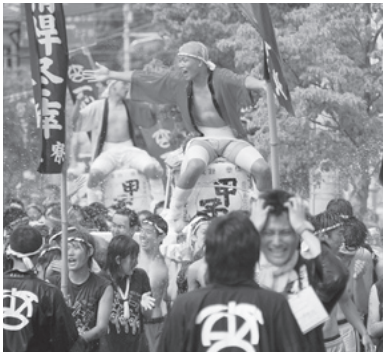
昨年行われた順天堂大学裸まつりの様子

今年の寮祭のスローガンは、「志翔祭響 轟かせろ!! 友と鳴らす祭りの鐘を」です。「志を高く持ち、寮祭という舞台で羽ばたき、啓心寮生の元気な姿を、また寮生が抱えている熱き魂をたくさんの方々に響かせよう」このスローガンにはそんな意味が込められています。 町の皆さん、毎年恒例の裸まつりは、今年は6月9日(日)に開催します。 これは、寮祭を開催するに