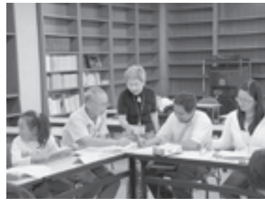
楽しく日本語を学ぶ受講生たち

ユニケーションが生まれていました。今後は、国際交流の橋渡しとしての役割にも期待がもたれます。