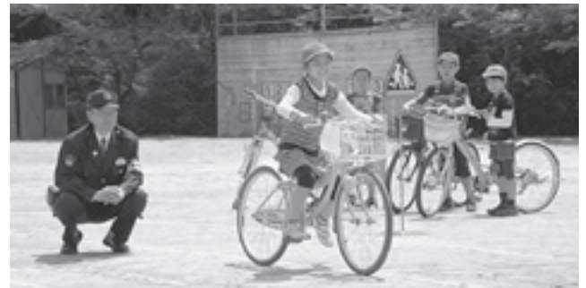
確認が済んだら出発！（大室台小で4月26日）