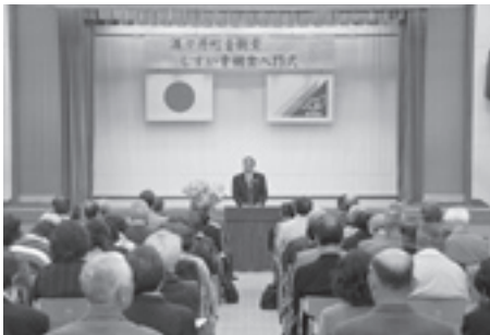
今年度 24 人が入門しました

4月24日に酒々井町青樹堂「しやすい青樹堂入門式」が中央公民館で開かれ、24人の入門生を迎えました。