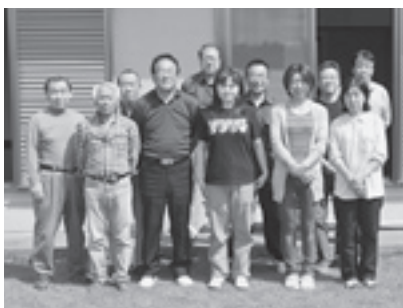
ネオポリス自治会の皆さん