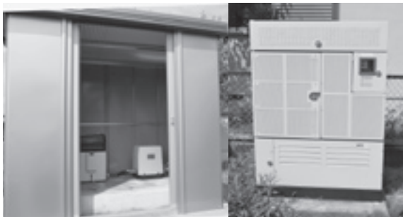
発電設備（右）と防災用井戸（音生の泉）