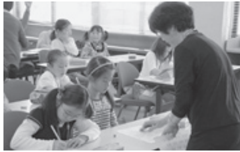
真剣に勉強する子どもたち

もテーマとしていて、今後は、「しすい青樹堂」との交流事業も視野に入れて進められる予定です。