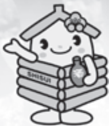
酒々井町マスコットキャラクター 井戸っこ(しすいちゃん)

5月7日に大室台小学校、15日に酒々井小学校のそれぞれの5年生が「田植え体験教室」で実際の水田で田植え作業を体験しました。