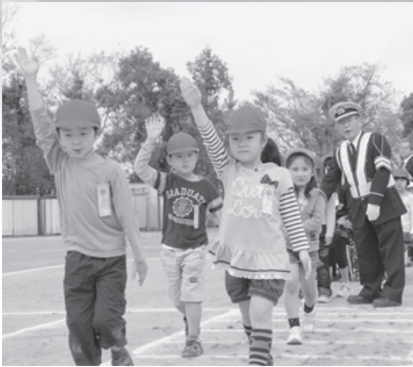
左右の確認、手をあげて（酒々井小で4月18日）