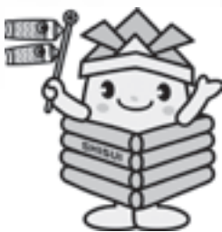
酒々井町マスコットキャラクター 井戸っこ(しすいちゃん)