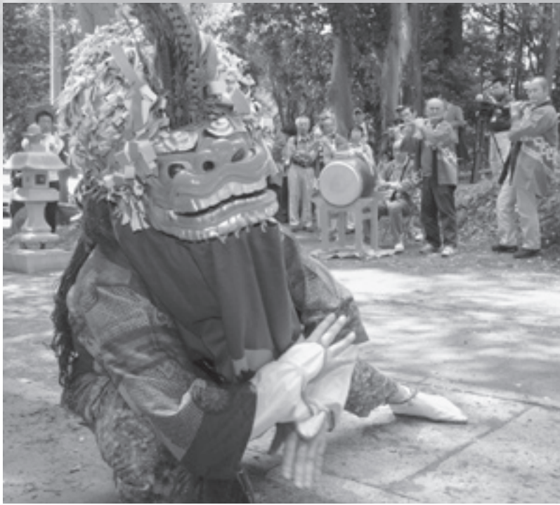
笛と太鼓の音色に合わせた見事な演舞です（駒形神社）