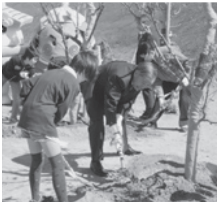
町の木の「梅」を植樹しました

酒々井ICの開通に先立ち、4月8日には、酒々井IC料金所前の花壇で開通記念植樹祭が行われ、酒々井小学校・大室台小学校の6年生の子も達20名が、しすいハーブガーデンの職員と一緒に、紅白それぞれの梅の木2本とハーブの苗700株あまりを植樹しました。