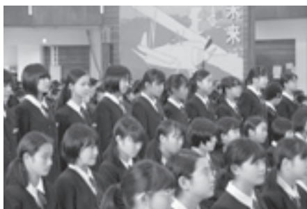
179名の新入生が一人ずつ呼名され起立