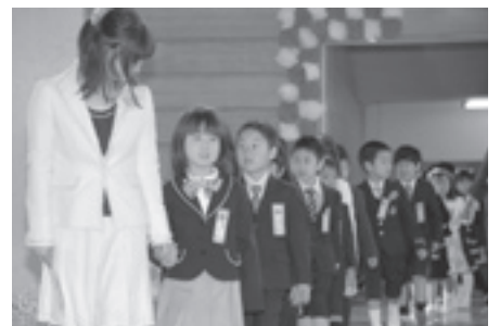
先生に手をつながれ入場