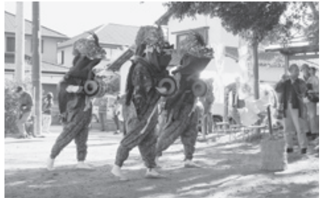
息がピッタリとあった演舞です（大鷲神社）