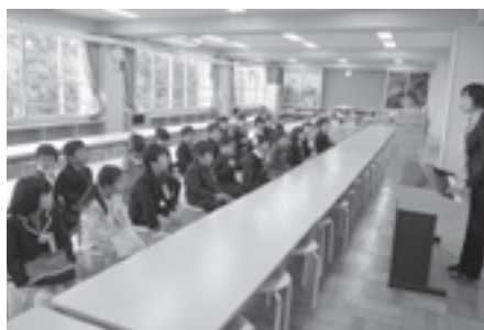
みんなで校歌の練習です