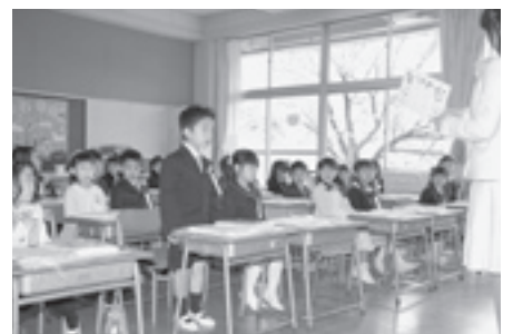
先生の目を見てしっかりあいさつ