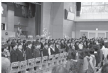
在校生が歓迎の歌で迎えました