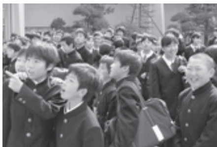
何組かなあ?新たな出会いが楽しみ