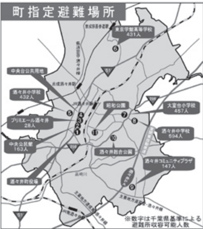
※数字は千葉県基準による避難所収容可能人数

もっとも身近な自主防災組織は家庭です。災害発生の際に家族が慌てずに行動し、無事に避難するためにも、家族で防災会議を開き、災害（地