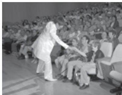
昨年の演芸会の様子

皆さんの長寿を祝い、「老人福祉大会」を開催します。大会では、88歳の方をお祝いする式典と水仙クラブの皆さんによる演芸会を開催します。大会に招待しているのは75歳以上の方です。