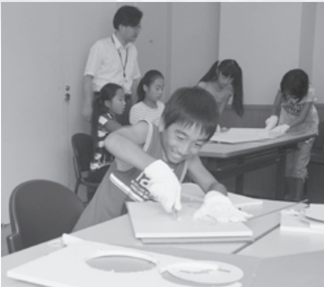
はじめは、カッターを使って発泡スチロールを型取り。楽しそうに見えるけど、これってけっこう難しい（理科工作教室）

参加した子どもたちからは「ハーブは種類によって香りと効能が違うのがわかった」「回転風をうまく飛ばすことが出来たので楽しかった」などの感想が聞かれました。