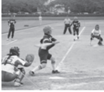
ソフトボール女子チームの攻撃

役員を含め約260人がそれぞれ出場し、柔道が準優勝するなど各競技で健闘しました。なお、上位入賞団体および個人入賞者は次のとおりです。