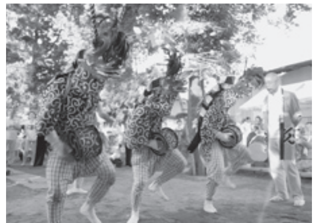
六所神社での演舞(墨の獅子舞)