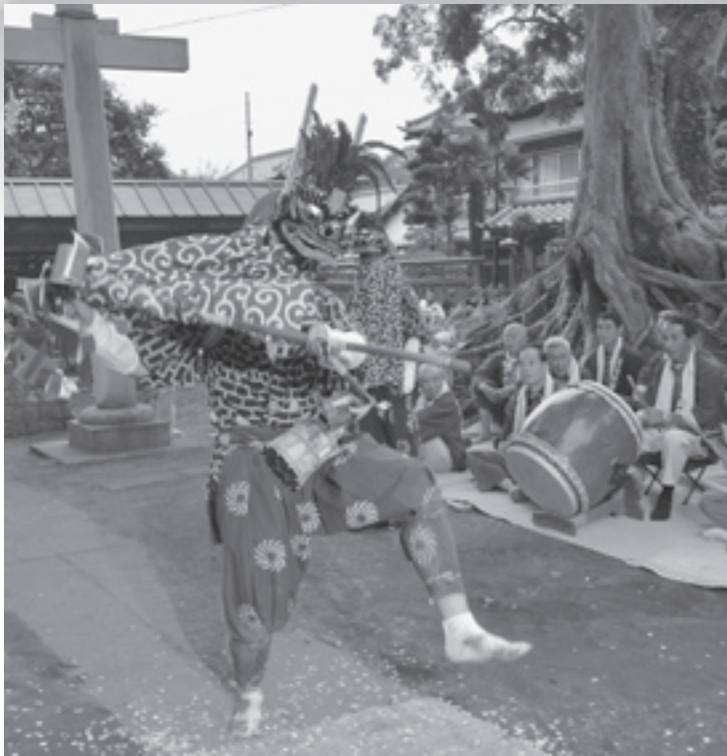
香取神社での演舞(馬橋の獅子舞)

地元保存会の皆さんは、この日のために練習を重ね、江戸時代から引き継がれている伝統の舞を演舞。境内に訪れた方々は、幻想的な舞をカメラに収めようと熱心にシャッターを押ししていました。