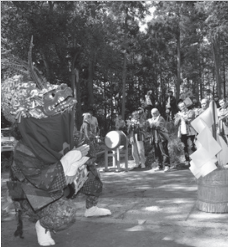
笛と太鼓の演奏に合わせ獅子舞が奉納されました