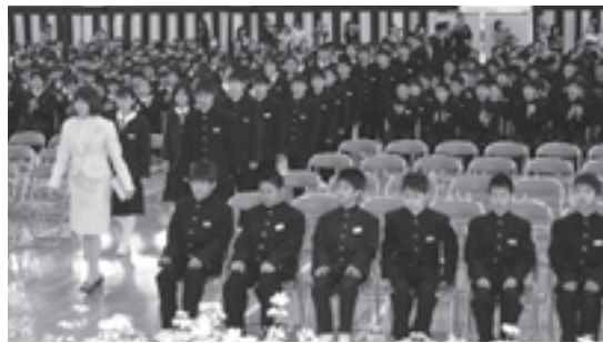
緊張した雰囲気の中で入場(酒々井中学校)