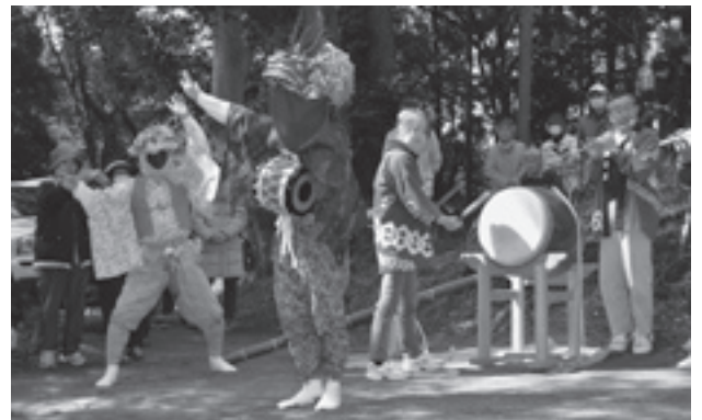
猿と獅子による絶妙な駆け引きも見どころです

各神社では「上岩橋獅子舞保存会」の方々が息の合った舞を披露。獅子舞を見学に訪れた方々は、迫力ある獅子を熱心にカメラに収めていました。