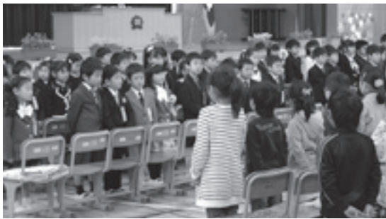
在校生(手前)が歌で歓迎(酒々井小学校)