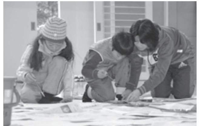
親子で協力してたこ作りに挑戦しました