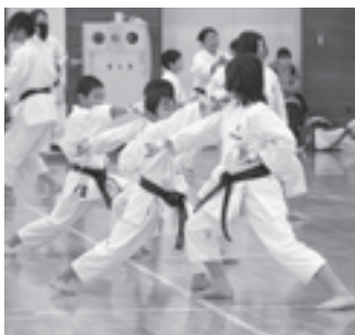
大きな声が響いた組み手