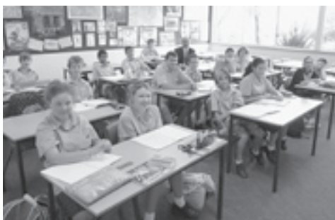
生徒たちを受け入れる学校の様子