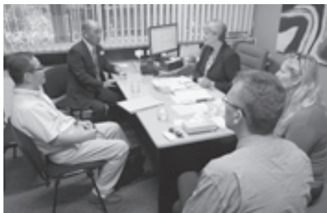
現地校の先生方と打ち合わせの様子