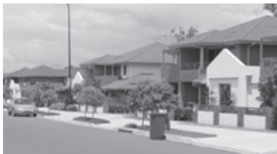
生徒たちが滞在する住宅街

この研修では、現地の一般家庭に滞在しながら現地校へ通い、学校生活を体験し、海外文化を学ぶことを目的とし