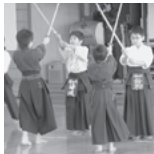
木刀を使っの演舞