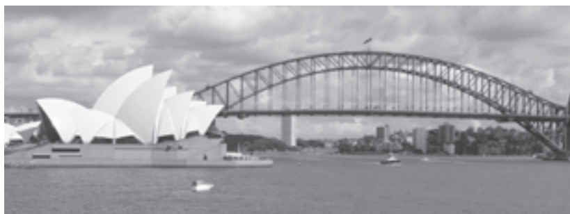
シドニーを代表する風景の「オペラハウス」と「ハーバーブリッジ」