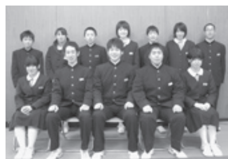
酒々井中学校生徒会役員の皆さん