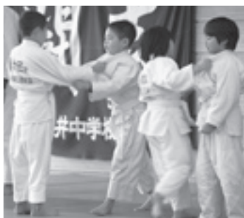
投げ技を練習する子どもたち