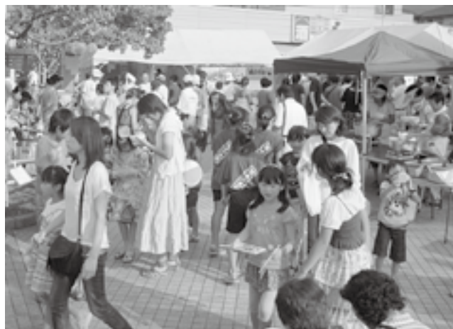
やさそばやとん汁などが無料で振る舞われました

この催しは、町民が相互に交流を図り、親睦を深めることを目的に実行委員会が主体となって開催。太鼓の演奏などのほか来場者も参加できる盆踊りやダンスなどアトラクションが行われ、1,000人以上を集めた会場を盛り上げていました。