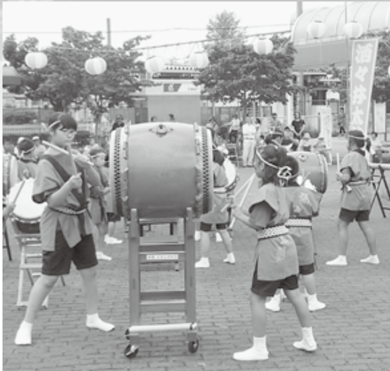
太鼓の演奏で会場を盛り上げた「酒々井太鼓」