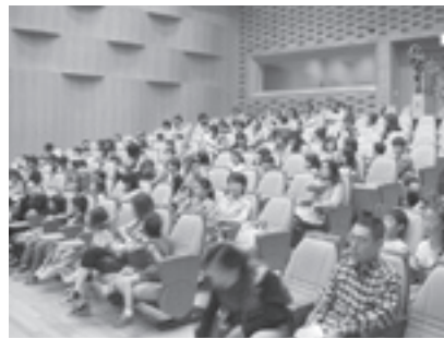
映画会には295人が参加しました

「地球のために一人ひとりができること」をスローガンに『環境を考える映画会』が6月15日、プリミエール酒々井文化ホールで開かれました。