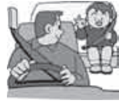
後ろのシートベルトOK