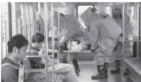
負傷者運び出す消防隊員