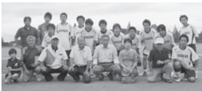
決勝戦で惜しくも敗れ準優勝となったサッカーチーム