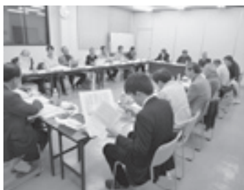
酒々井ブランドを創出します