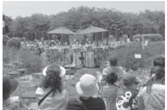
「ココナッツアイランドしすい」のウクレレ演奏