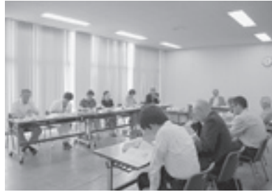
活発な議論が行われました

懇談会では、従来の公的な福祉サービスにとられず、新たな福祉体制の構築を目指し、多くの時間と活発な議論が重ねられました。