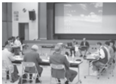
各団体のつながりも育ってきているようです

5月14日、中央公民館講堂を会場として「平成22年度住民公益活動補助金実績報告会」が開催されました。