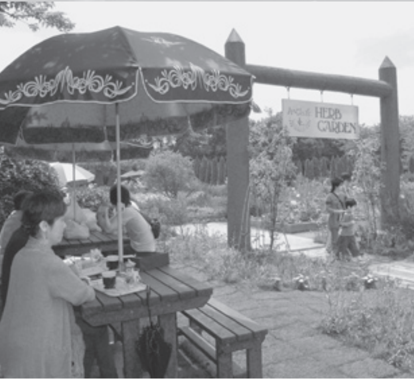
ハーブが香る安らぎの中でティーブレイク

初夏の陽気となった5月14日、酒々井ハーブガーデンで、恒例の「ハーブガーデンまつり」が開かれました。 爽やかなハーブの香りに誘われるように多くの方が来場し、お気に入りの苗を求めたりハーブを使った料理を食べたり会場はにぎわいました。また当日は、「サラズ・バンク」や「ココナッツアイランドしすい」などの演奏会も行われ、訪れた方々を懐かしいメロディーで癒しました。 これからガーデンは、花盛りを迎えます。皆さんもハーブがもたらす安らぎを感じに足を運んでみませんか。