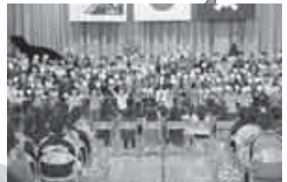
2年生が合唱で歓迎