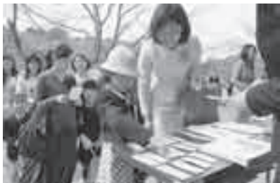
わたしの名札みつけたよ