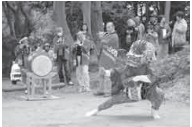
笛と太鼓の音色に合わせて演舞する獅子