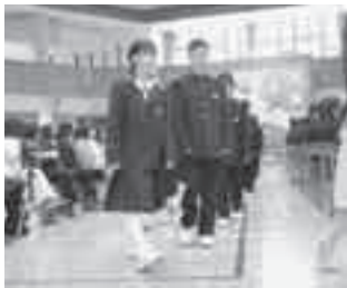
初々しい制服姿で入场