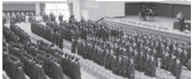
2・3年生（左）が中学校伝統の合唱で歓迎