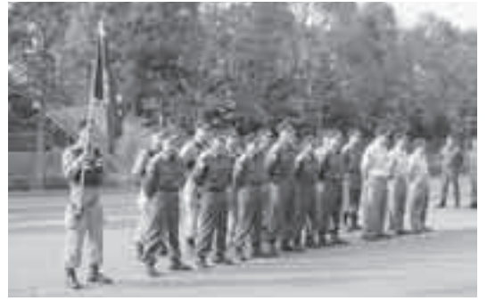
消防本部を出発する隊員の皆さん

なお、現在も交代で救援活動を行っています。ご家族と離れ、任務にあたられている隊員の方々の安全をお祈りします。