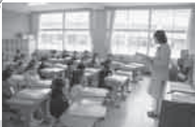
担任の先生と対面