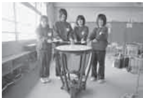
寄贈されたティンパニと吹奏楽部の生徒