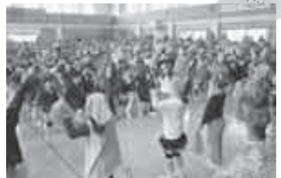
2年生がダンスで歓迎