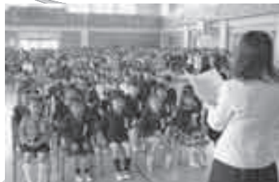
元気に返事をする新入生