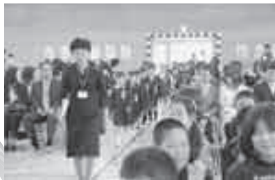
緊張した雰囲気の中を入场