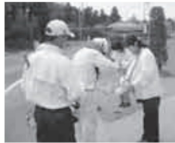
赤十字奉仕団の皆さんによる募金活動

街頭募金や役場、社会福祉協議会でお預かりした義援金額は4月15日現在、223万7千185円となりました。この義援金は、日本赤十字社を通じ、被災地の復興支援に役立てられます。