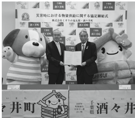
(左から)株式会社くすりの福太郎春田社長、小坂町長