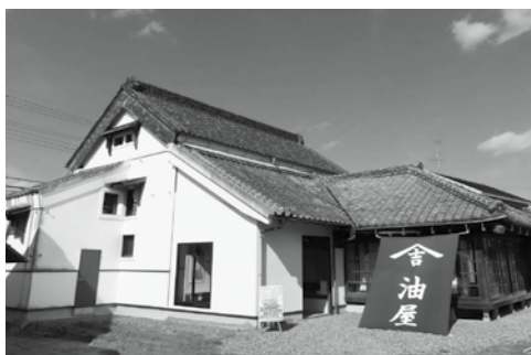
旧蒔家住宅店舗兼主家