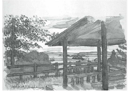
「築山」 田辺知治氏 画