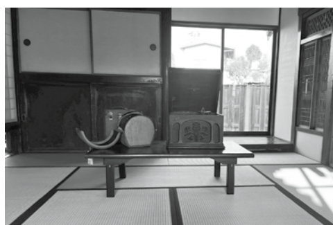
1階和室（蓄音機・レコード）