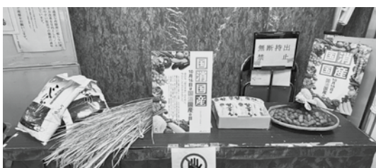
特産品などの展示