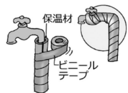
〈図〉むき出しの水道管の防寒方法