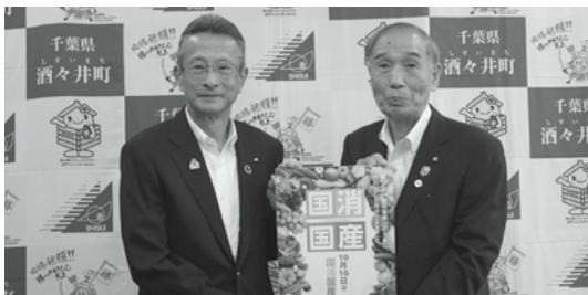
(左から)JA成田市栗原代表理事組合長、小坂町長

問い合わせ 経済環境課農政振興班 ☎(382) 2338、JA成田市 ☎0476(22) 6711