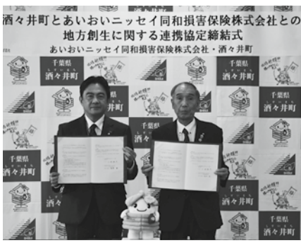
(左から)菅野理事 千葉支店長、小坂町長