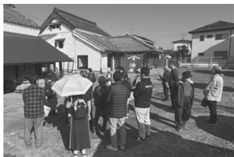
庭先でガイドの説明を受ける様子