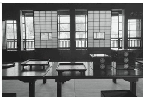
2階和室（御膳・重箱）