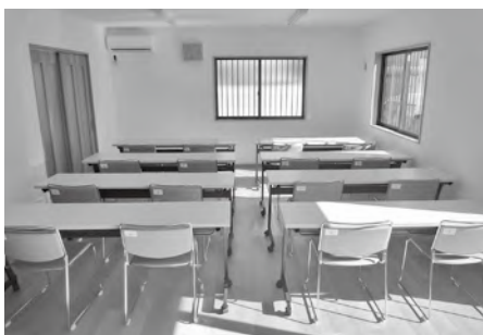
助成金で購入した机と椅子