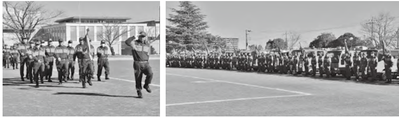
消防出初式の様子

1月11日、新春の年頭を飾る恒例の「令和7年酒々井町消防出初式」が、中央台公園で開催されました。 式には、多数の来賓が出席し、千葉県知事、千葉県消防協会長などから、これまでに功労のあった消防職員・団員に対して、各種表彰が行われました。 また、昨年度限りで消防団を退団された方に対して感謝状の贈呈が行われました。 問い合わせ ぐらし安全協働課危機管理室 ☎280