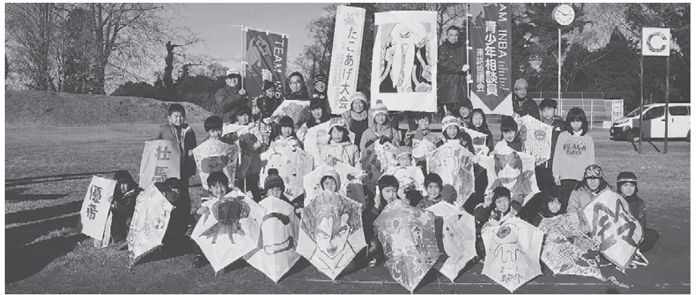
たこあげ大会の参加者