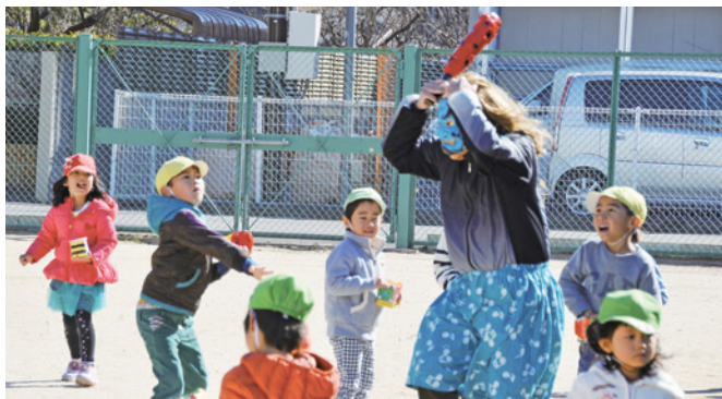
岩橋保育園の豆まき 元気な園児たちに鬼もたじたじ