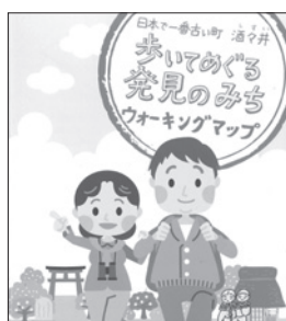
住民協働により製作したウォーキングマップ

GIS(地理情報システム)を導入し、地震ハザードマップや洪水ハザードマップなどの情報を町民へ広く発信しました。