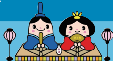
酒々井町マスコットキャラクター 井戸っこ(しすいちゃん)