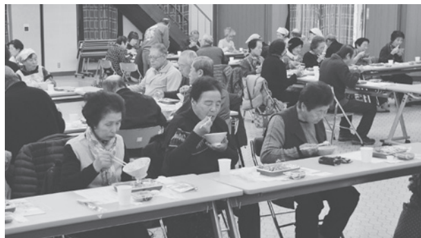
七草粥を食べる会の様子

1月31日、町郷土研究会主催による「七草粥を食べる会」が約100人の参加者が一堂に会して中央公民館講堂で開かれました。当日提供された料理は、町内で採れた野草等を使い、会員が工夫をこらし、まごころを込めて調理をしたもの。多くの参加者は「七草粥や天ぷらなど本当においしくいただき、たくさん食べました」と話され、早春の味覚を堪能していました。