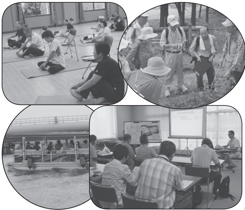
新しい発見や体験で充実した青樹堂ライフに！

しすい青樹堂では、町をもっとよく知るため、様々な分野を幅広く学ぶ「しすい学」、施設見学や自然観察などの館外学習を予定しています。