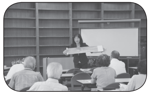
講義にも熱が入ります！