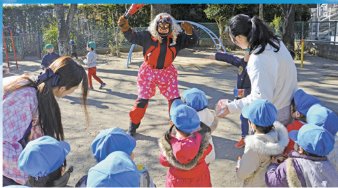
中央保育園の豆まき みんなで鬼を追い払え