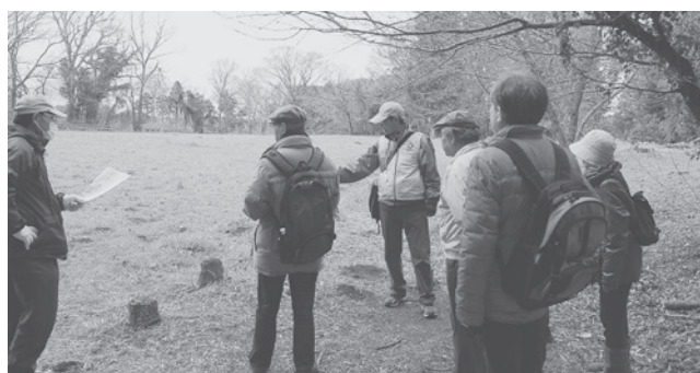
昨年の見学会の様子