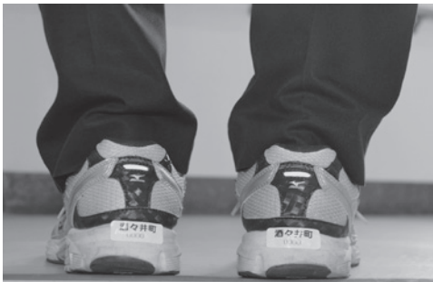
ステッカーシールを 貼った靴