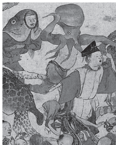
参考 / 蝶々踊り屏風

もと本佐倉城下で行われていたが、天正十八(1590)年に千葉氏が滅亡すると新しく領主となった徳川家康の命令により本佐倉城下町は再編され祭礼の場所は酒々井に移りました。