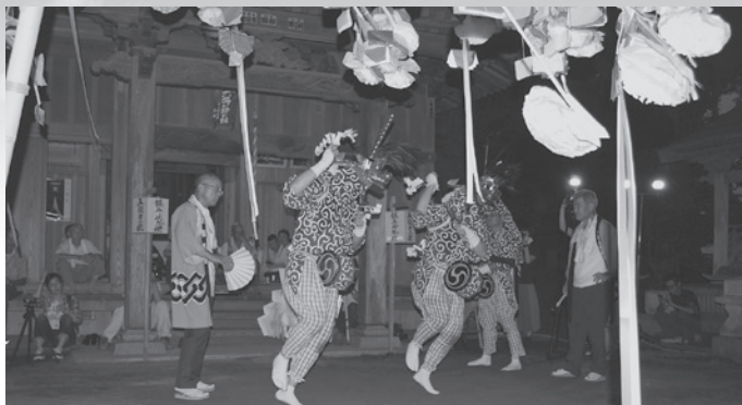
六所神社での演舞：墨の獅子舞