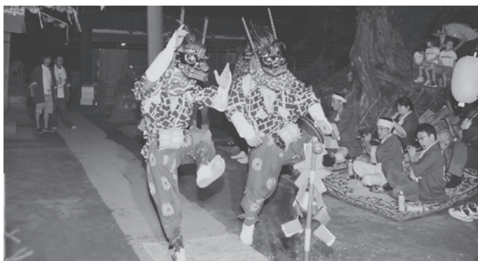
香取神社での演舞：馬橋の獅子舞

五穀豊穡、雨ごい、悪疫退散などを祈願するため、馬橋区香取神社の獅子舞が7月16日、墨区六所神社の獅子舞が7月17日に両地区の鎮守である神社で舞が奉納されました。