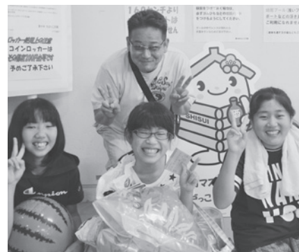
2016年、最初の入園者 仲良し3人組と引率のお父さん

開園すると同時に来園者は、続々と園内にある全長380メートルの流れるプールやちびっこスライダー、ちびっこプールに入水し、水の冷たさを肌で感じながら、気持ちよさそうに泳いでいました。