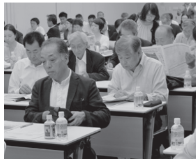
議会活動を適切に伝えるため研修