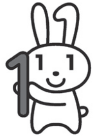
マイナンバー広報用 ロゴマーク 「マイナちゃん」