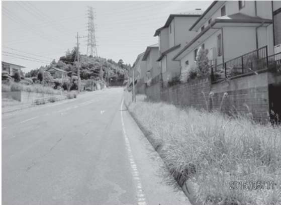
大室台小、酒々井中の通学路（右側が未整備の歩道）