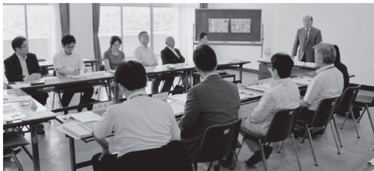
ふるさと酒々井創生アドバイザー会議には幅広い分野の方が参加

町の実情を踏まえた酒々井町人口ビジョンや町総合戦略の策定など地方創生の推進に向け「酒々井町まち・ひと・しごと創生本部」を平成27年4月1日付けで設置しました。