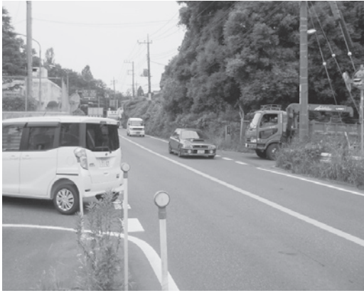
県道と町道が接続する交差点（左側が中川地区）