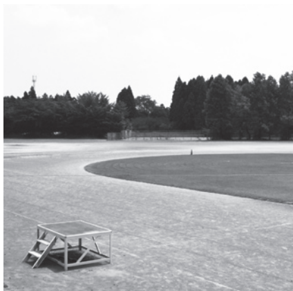
現在の中学校グラウンド