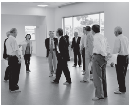
災害対策拠点となる分庁舎を視察

町議会では、6月11日の定例会終了後、役場分庁舎の建設状況を事業者の説明を受けながら、視察しました。