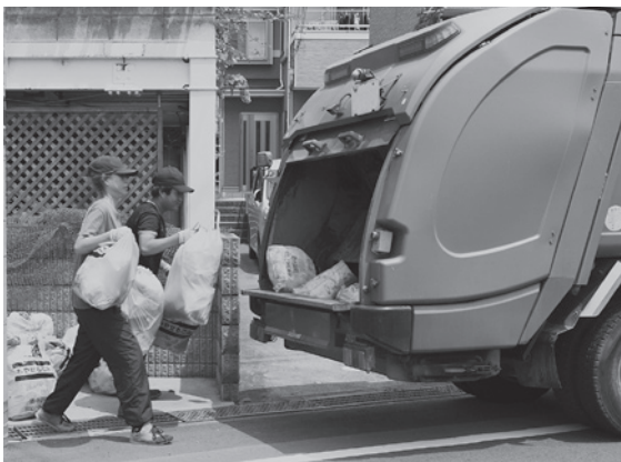
町内のごみ収集状況

経済環境課長 外国人によるごみの出し方について、多くの住民から意見をいただいていることから、英語、中国語、韓国語によるごみの排出、分別方法を表記した簡易的な掲示物を作成し、外国人転入者や自治会等に配布できるように検討していきたい。