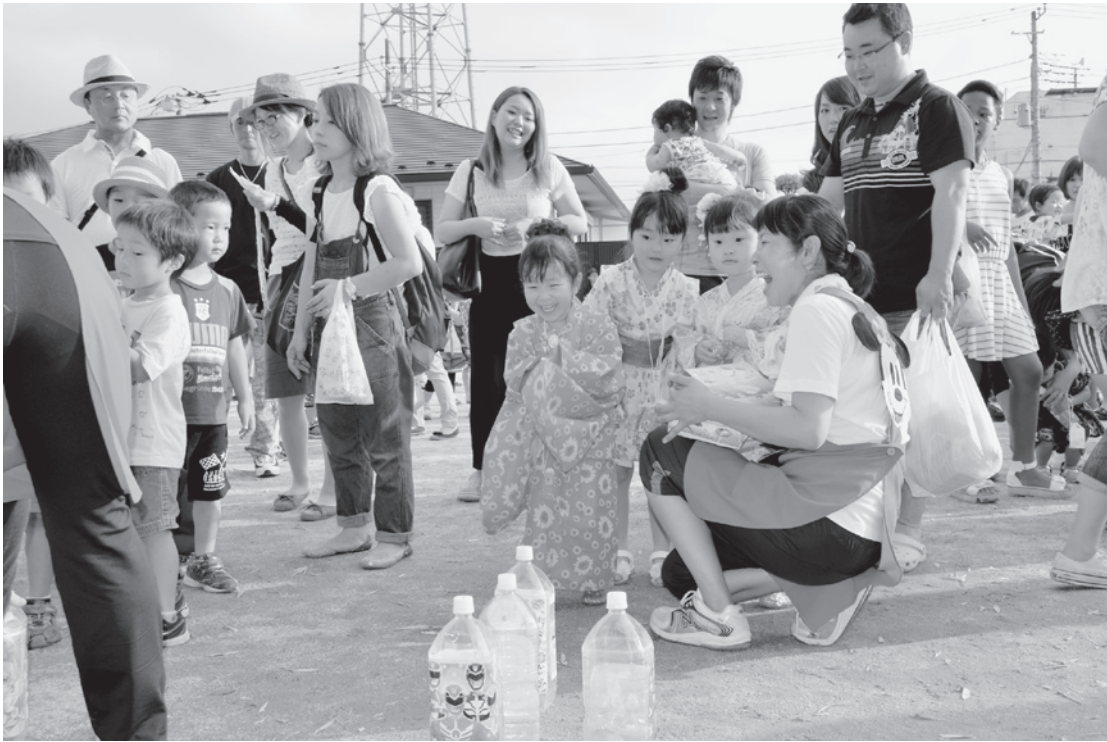
安心して子育てができるまちづくりを推進 (写真は岩橋保育園の夕涼み会)