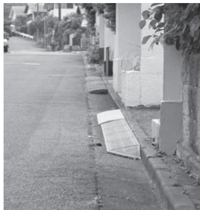
道路に置かれた乗り上げブロック

まちづくり課長 自宅や駐車場入り口前の道路上に道路との段差を解消するために設置されている乗り上げブロックは、交通安全上支障が出る恐れがあることから許可した事例はない。