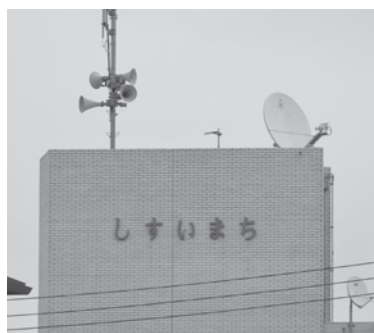
緊急情報等を放送する防災無線