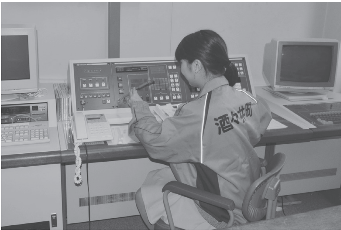
災害時などに皆さんに必要な情報をお伝える防災行政無線（写真は現在の無線設備）