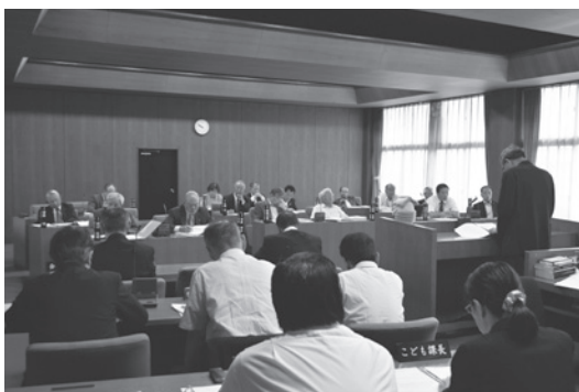
議員の1回目質問には町長は登壇して答えます

また、質問方式は「一括方式」を採用しており、一人当たりの持ち時間は、答弁を含めて60分となっています。