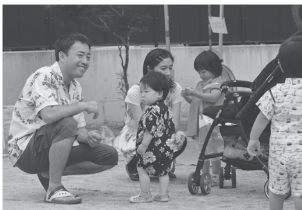
子育てに積極的に参加する父親が増えています

町長 町では父親になる方への準備としてマタニティ・ママパルクスを行い、妊娠中の健康管理と出産、子育てについての講義やお父さんの妊婦体験を実施している。また、母子健康手帳交付時に子育てのアドバイスや父親向けの