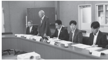
町長と議長が歓迎のあいさつをしました

群 馬県北群馬郡榛東村の議会運営委員会7名が5月20日に視察研修のため、来庁しました。