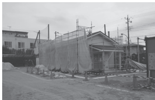
工事が中断している青少年交流の家

に関する条例」の附則において、条例の施行日については、公布の日から3月を超えない範囲内において規則で定めるとしていたが、施設の建築完了の目的が立たないことから、この条例を廃止する条例を制定するもの。