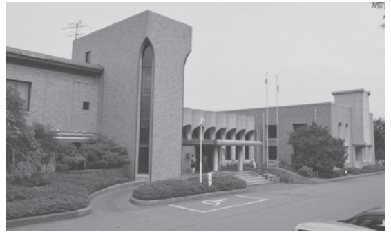
耐震改修で、より安全な中央公民館に

制度改正に伴う臨時福祉給付金、年金生活者等支援臨時福祉給付金の支給経費、青年就農者確保・育成給付金の新設、酒々井駅とアウトレットを結ぶ路線