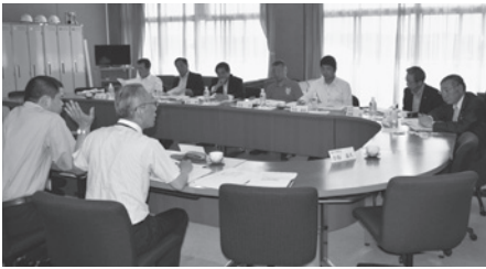
企業進出による影響等を説明しました

埼 玉県深谷市議会の会派「深谷同志会」7名が5月13日に酒々井プレミアムアウトレットの誘致関連について、視察研修のため、来庁しました。