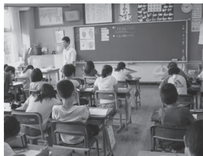
平等な義務教育を求め国庫負担を要望

するという観点からいえば、政策的に最低保障として下支えしている義務教育費国庫負担制度は必要不可欠である。教職員の給与を義務教育費国庫負担制度から適用除外することは、財政負担を地方自治体に課し、厳しい地方財政をさらに圧迫するものである。また、義務教育の円滑な推進を阻害する恐れも出てくることから、義務教育費国庫負担制度の堅持を要望するもの。