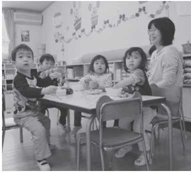
子どもたちを見守る保育士

少子化対策の一環として、待機児童の解消が重要となつてくるところから、保育水準の低下を招かないために、公立保育所の一般財源化を廃止し、直接補助制度にすることを求め、国に対して意見書を提出するもの。 ※賛成少数で否決