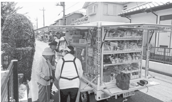
栄町で実施している移動販売車

できれば、町民に広く門戸を開き、食品関係の仕事のリタイアした人、商工会の事業者、すでに似た形態で事業を行っている事業者、これから起業を考えている人などを集め、町として説明会を開催してほしかった。 総括質疑では、中身はまだ流動的で議論する余地があり、予算執行にあたっては、計画の不透明な点など、更なる議論を煮詰め、節約、費用対効果を期待して賛成する。