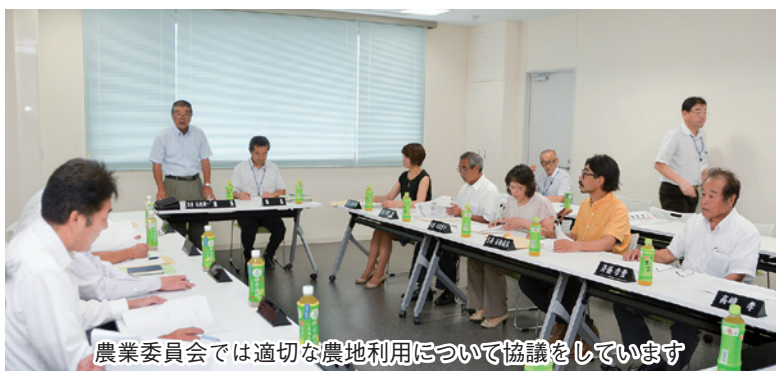
農業委員会では適切な農地利用について協議をしています

農業委員会とは 農業委員会の主な業務は、農地の売買・貸し借りの許可や農地転用の許可および届出受理、農地等の利用の最適化の推進など農地に関する業務等を行います。農業委員会は、農業委員8人と、農業委員会が委嘱する農地利用最適化推進委員6人で構成されています。 今号では、農業委員4人のご意見を掲載しています。