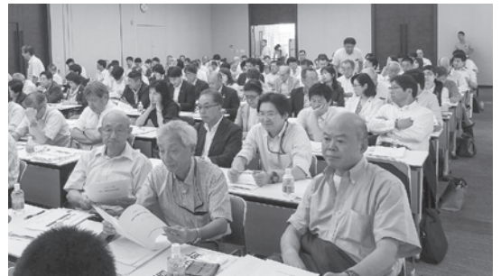
議会だより編集特別委員会のメンバーが受講

また、議会だよりにおいて先進的な取り組みをしている市町村議会の事例を紹介いただくことで、住民に読まれ、伝わる工夫について、学ぶことができました。 今後は、この研修で学んだことを生かしながら、町民の皆様が満足いただけるような紙面づくりに取り組んでまいります。