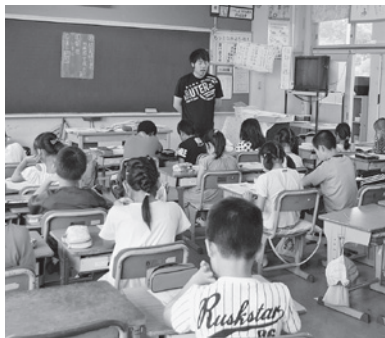
子どもたちの教育環境は国の責任で

政府は、義務教育費国庫負担制度を見直しや廃止を言及しているが、同制度の見直しは、義務教育の円滑な推進に大きな影響を及ぼすことが憂慮される。よって、国においては、21世紀の子どもたちの教育に責任を持ち、教育水準の維持向上と地方財政の安定を図るため、同制度を堅持するよう強く求める意見書を内閣総理大臣、財務大臣、文部科学大臣、総務大臣に提出するもの。