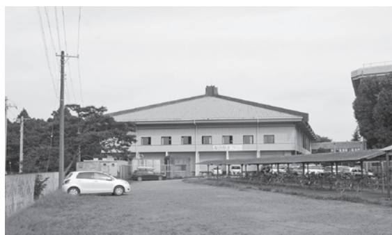
屋根改修工事が求められている中学校体育館

小坂町政が平成17年12月にスタートした後、酒々井中学校体育館の屋根の雨漏り修繕を平成19年と平成22年に実施し、その