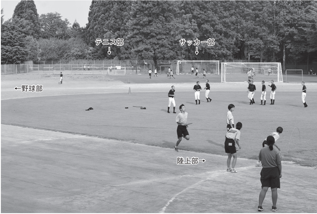
中学校のグラウンドは段階的に拡張事業を実施予定