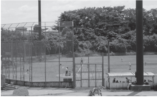
公園の運動施設率を規定（写真は総合公園）