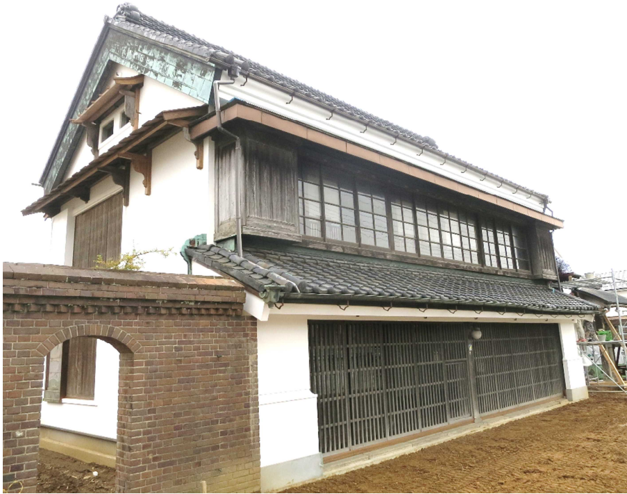
「旧勘家住宅店舗兼主屋」正面北から