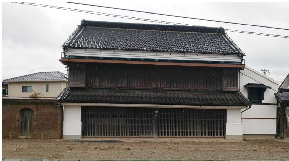
「旧蒔家住宅店舗兼主屋」正面西から

この登録制度は、近年の国土開発や都市計画の進展、生活様式の変化等により、社会的評価を受けるまもなく消滅の危機に晒されている多種多様かつ大量の近代等の文化財建造物を後世に幅広く継承していくために作られたものです。届出制と指導・助言等を基本とする緩やかな保護措置を講じるもので、従来の指定制度（重要なものを厳選し、許可制等の強い規と手厚い保護を行うもの）を補完するものです。