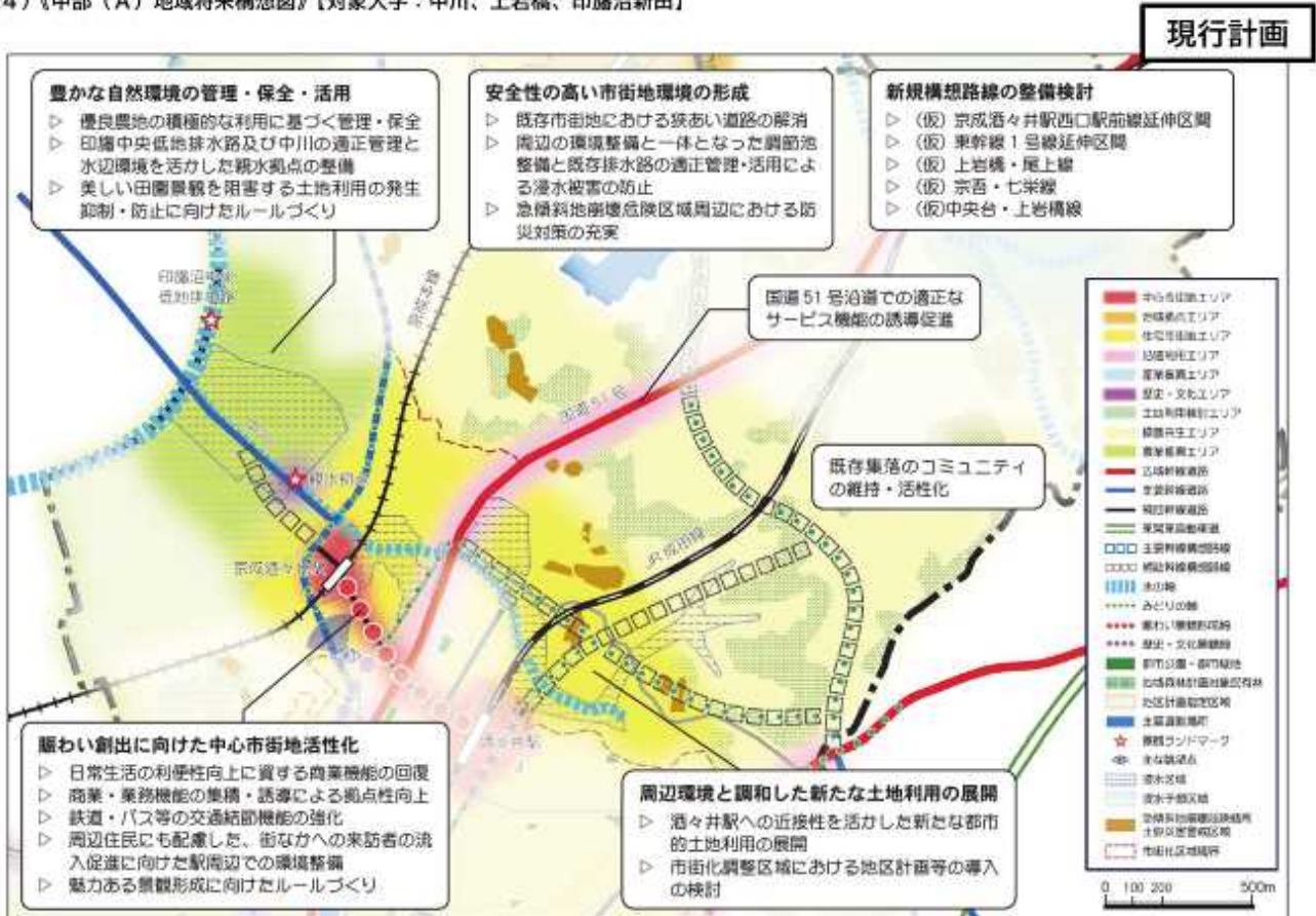
(4) 《中部 (A) 地域将来構想図》【対象大字：中川、上岩橋、印旛沼新田】