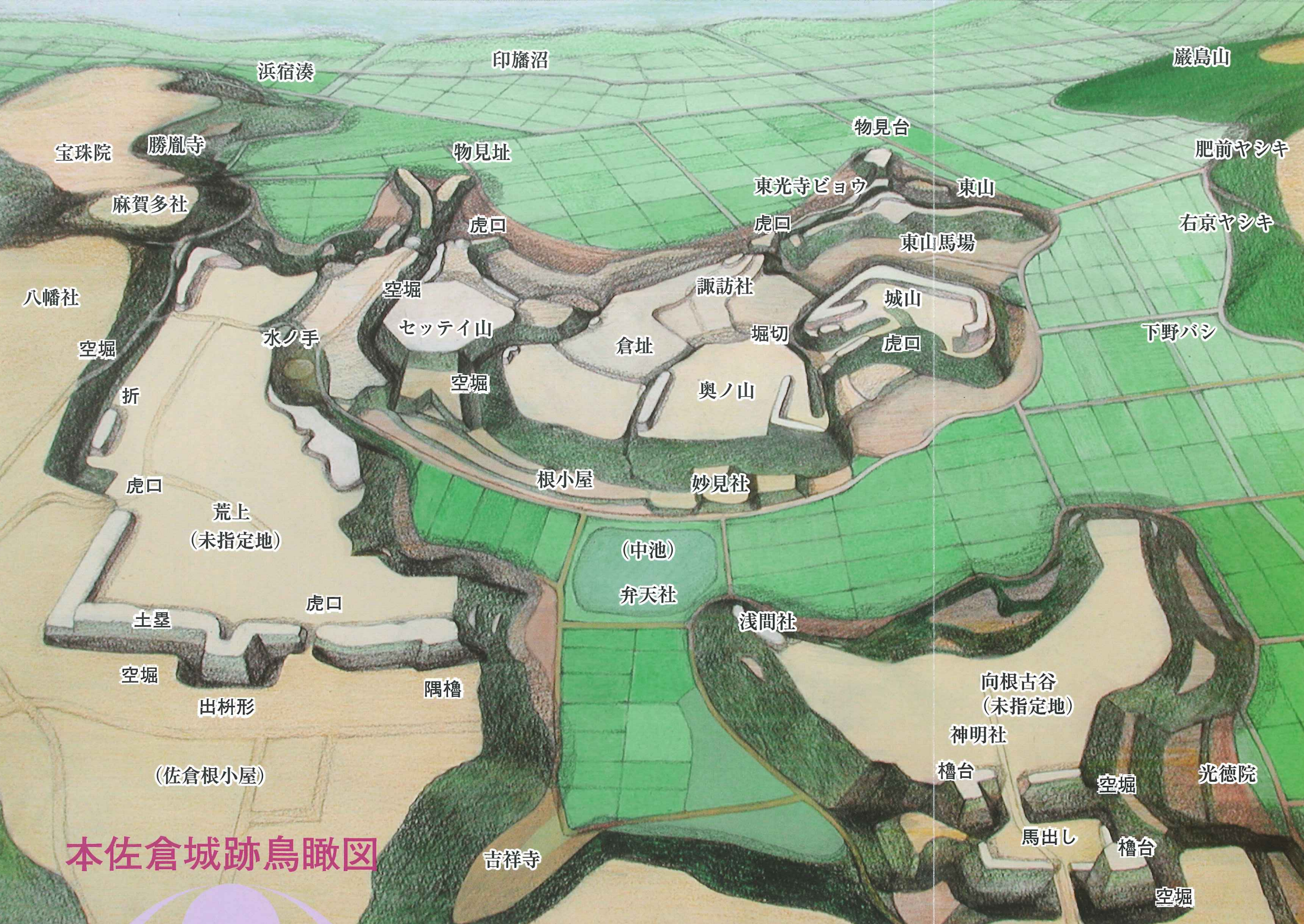
本佐倉城跡鳥瞰図