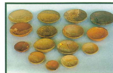
儀式用の酒杯(かわらけ)