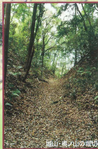
城山・奥ノ山の堀切