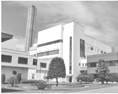
稼働開始から37年が経過した ごみ焼却施設（酒々井町墨地区）