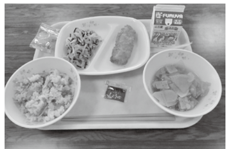
児童・生徒に提供された給食