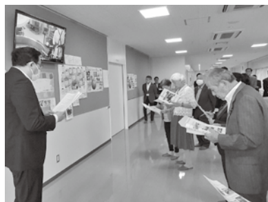
富里市担当者から説明を聞く様子