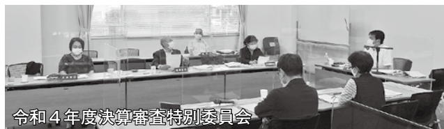
令和4年度決算審査特別委員会 執行部からの詳細な説明を受け、きめ細やかな案件の審査を行います

さらに、議会の運営に関することや議長からの諮問に関することを協議し、議会をスムーズに進めるために開く議会運営委員会があります。