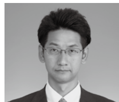
小坂 和也 議員