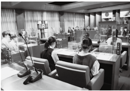
令和4年度こども模擬議会の様子

総務課長 当町では、児童・生徒が主体的に郷土を学習する、ふるさと学習「酒々井学」に主権者教育のプログラムを組み込み、児童・生徒が町の課題