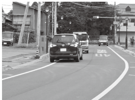
電線共同溝工事を実施している 町道02-009号線 (酒々井地区)

問 過去の答弁では、「町議会の議決を経ていない」理由として、「事業の内容が工事ではなく、委託だからと説明しているが、当初の契約締結の際は議決を経ている。また、工事は年度内に完了したので町議会の議決は不要だった。との説明もあつたが、付帯工事は「年度経過後」にも実施している。町議会に「変更のための議決」を提案しなかつた理由は何か。