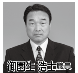
御園生 浩士 議員

町長 酒々井町は子育て世代の若い人が増えている町ということで、日本経済新聞で特集が組まれていた。町としても、子どものための施策を限られた財源の中であるが、しっかりやろうと考えている。