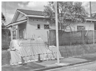
係争中の青少年交流の家外階段部分

町としては、工期短縮に向け、事業者と協議を行っており、早期に事業が完了できるよう努めている。