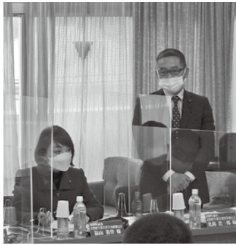
南関町の現状と課題を説明されました