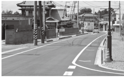
早期完成が望まれる町道02-009号線

まちづくり課長 当該区間は、交通安全事業と緊急輸送道路の確保を目的に無電柱化事業を併せて実施しており、令和4年度中の完了を目指していたが、電線管理者による電線引込工事等に時間を要しており、事業者から令和6年度までの工事工程が示されている。