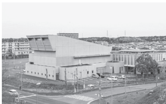
プリミエールの増築は令和2年3月完成予定

年5月17日に制限付き一般競争入札を実施した結果、国井建設株式会社が落札し、1億4300万円で仮契約を締結したもので、議会の議決を求めるもの。 ※賛成多数で可決