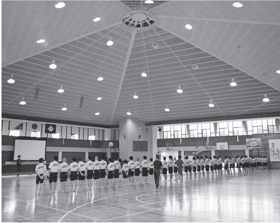
酒々井中学校体育館の改修工事は本年度に設計業務が行われます