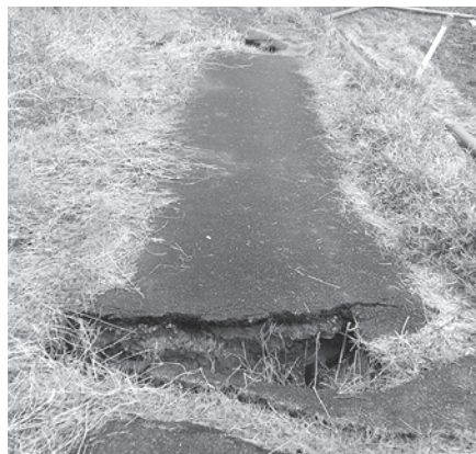
土砂の影響で破損した町道

問 今後の被害防止のために、町の残土条例を拡張して、3000㎡以上の再生土についても許可制の対象とし、撤去費用を担保するための保証金制度を設ける予定はあるか。