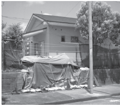
平成30年から裁判が続いている交流の家

教育次長 青少年交流の家の経過は、平成31年3月7日、4月25日、6月3日に弁論準備手続きが行われ、審議が行われた。また、今回は、令和元年8月19日に弁論準備手続きとして行われることになった。今後は、裁判が繰り返され、判決または和解勧告が裁判所よりなされ、これを受け入れる場合は、議会の議決が必要となる。ただし、内容に不服の場合は、裁判の継続または上訴することになる。経費については、訴訟に係る印紙代、郵便代、弁護士委託の着手金、弁護士委託料で合計153万7千円となっている。