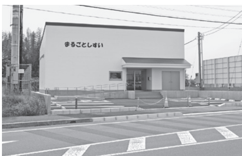
地方創生拠点整備交付金事業を活用した飯積の(仮称)まるごとしすいは開業準備中

等備蓄施設建築事業」や「道路の改良事業」など繰越明許費を設定した21事業について、翌年度に繰り越す額が確定したため、報告するもの。