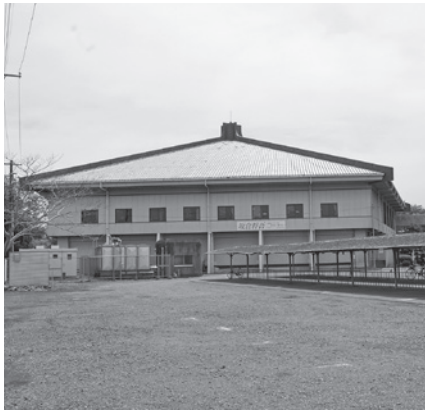
早期の改修が求められている体育館

こども課長 体育館の改修に向け、本定例会に実施設計の補正予算を計上した。実施設計の完成後、できるだけ早期に工事着手できるように努めていく。財源は国庫補助金の内定を受けており、対象経費の3分の1を見込んでいます。