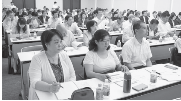
議会だより編集特別委員会のメンバーが受講しました

令和元年7月5日に県町議会議長会主催の議会広報研究会に議会だより編集特別委員会のメンバーが参加しました。 研修では、広報サポーターの芳野政明先生から議会だよりの役割と意義の講演をしていただきとともに、各市町村の議会だよりを芳野先生が講評し、効果