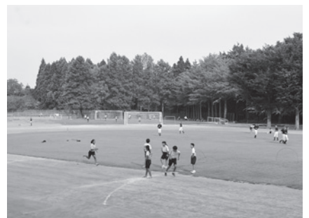
中学校のグラウンド拡張事業は用地買収に伴う不動産鑑定を予算化

今回の補正は、本年10月の消費税引き上げに際し、景気対策の一環として国が補助をして