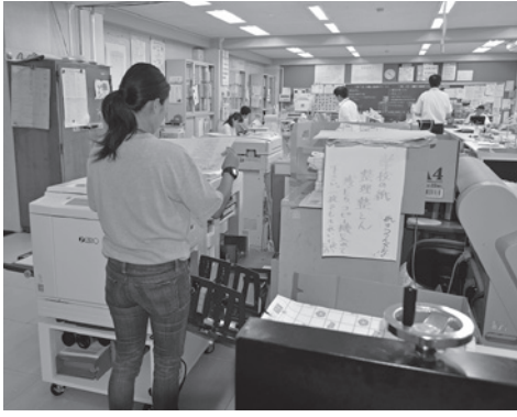
教材の印刷をするスクールサポートスタッフ (写真手前 6月27日から配置)