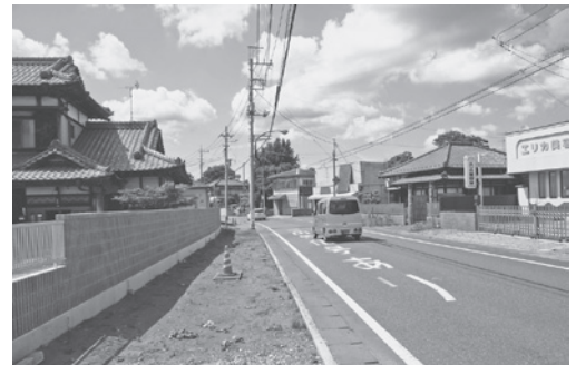
無電柱化の工事が進められている町道（横町線）

広域幹線道路を補完する地方道路は、地域の生産性向上や活力向上、産業・物流拠点や自然・観光・文化などの地域資源との