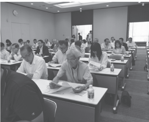
編集方法や読まれるコツを学びました

当町の議会だよりの総評は、おおむね適切との評価をいただきましたが、改善点などのご指摘もいただきましたので、今後の紙面づくりに生かしていきたいと思えます。これからも「伝える」議会だよりから町民の皆さんに「伝える」議会だよりの発行に努めていきます。