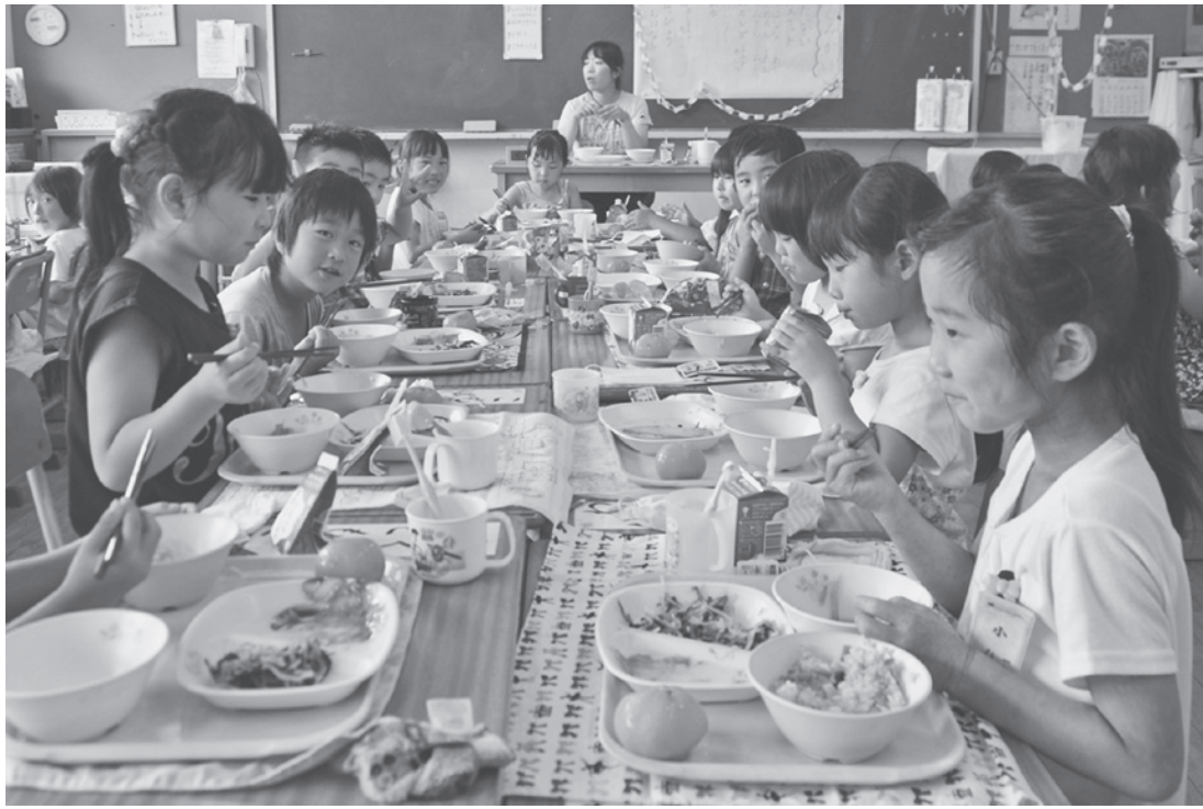
多子世帯に対する支援として9月から無償化を実施