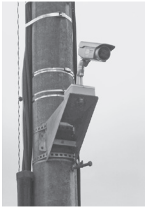
防犯カメラを活用し犯罪予防

総務課長 防犯カメラ設置については、犯罪の予防や犯罪捜査、また、安全安心なまちづくりを推進するうえで効果があると考え、町は県の補助金を活用して設置していきたいと考えている。自治会等への防犯カメラ設置助成制度は、まずは、佐倉警察署と防犯カメラ