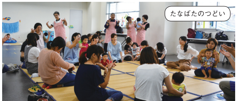
あいあいルームでは親子が楽しめるイベントも企画しています