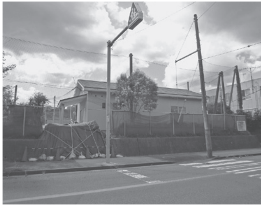
工事が中断している青少年交流の家