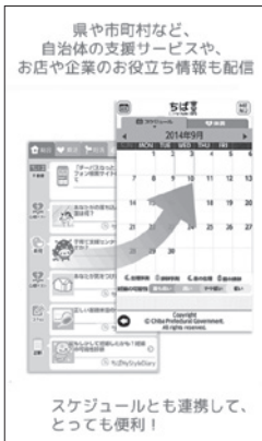
結婚から子育てまでアプリがサポートします

こども課長 当町において、高校3年生までを対象にした場合の費用を試算すると、平成28年度の中学生医療費助成額のすべてを高校生に置き換えた場合、1641万6千円が新たに必要になると見込まれる。この費用には国、県からの補助がないので全額を一般財源で賄うことになるため、子ども医療費助成の拡大は現時点では、厳しい状況と考えている。町としては、対象年齢の拡大について国、県の動向や近隣市町村の状況を見ながら検討することになる。