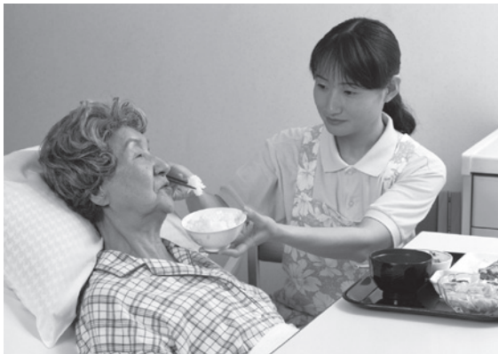
在宅介護支援の拡充を ※写真はイメージです。

介護ボランティア制度の見直しで、活動分野を「在宅介護」に広げることについては、他人の目が届かない居宅内の活動となるため、ボランティア中の事故等の発生が懸念されることや認知症等、判断能力が十分でない方を対象とした活動も含まれ、ポイント付与等が適正に行えるかといった課題がある。年齢要件の撤廃については、ポイント換金の財源となる地域支援事業の対象は65歳以上の高齢者という条件であることから、今後の検討課題であると考えている。