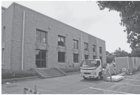
耐震工事が進む中央公民館（講堂側）

平成28年度一般会計予算のうち「中央公民館耐震補強事業」を平成28年度および平成29年度の継続事業として執行しているが、平成28年度年割額のうち年度内に支出を終わらなかつたものについて、通次繰越の処理をしたことから、報告するもの。