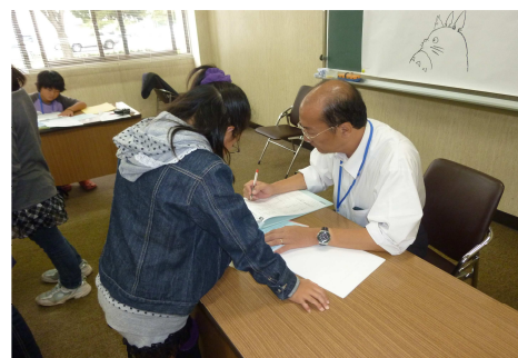
学ぶ土曜日！こども青樹堂