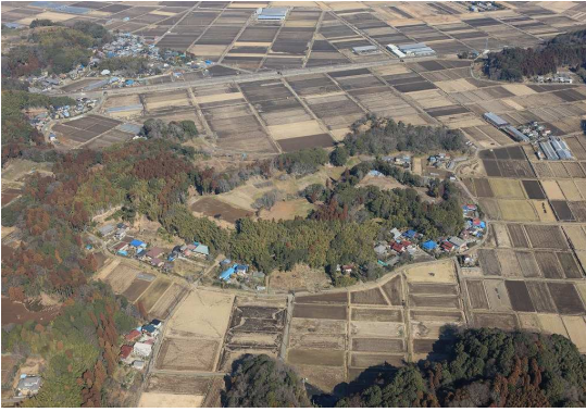
国史跡 本佐倉城跡