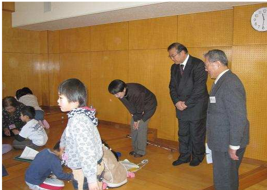
教育委員による先進地視察