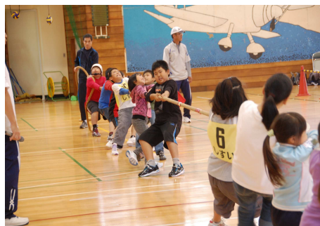
スポーツ・レクリエーション祭