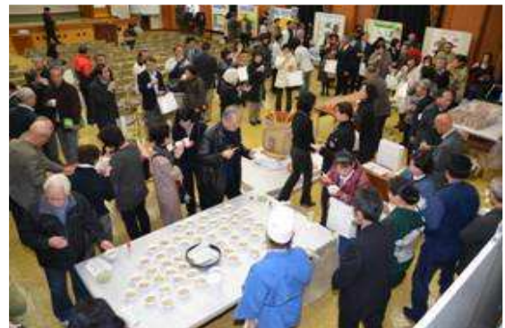
60歳を対象に盛年式を実施