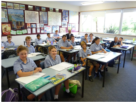
オーストラリアの学校を視察