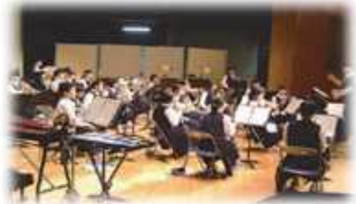
オータムコンサート（プリミエール酒々井）