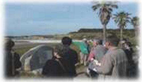
しすい青樹堂（銚子 屏風ヶ浦）