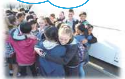
ケリービル・ハイスクール門前

（オーストラリア シドニーの ケリービル・ハイスクールの生 徒たちと別れを惜しむ！）