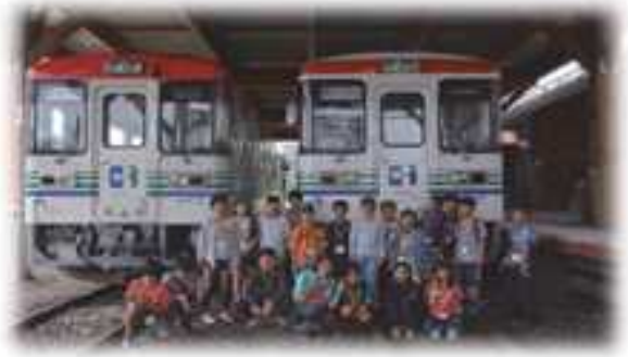
北海道陸別町児童交流事業（りくべつ鉄道車庫）