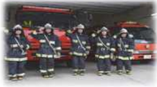
キャリア教育（酒々井消防署）