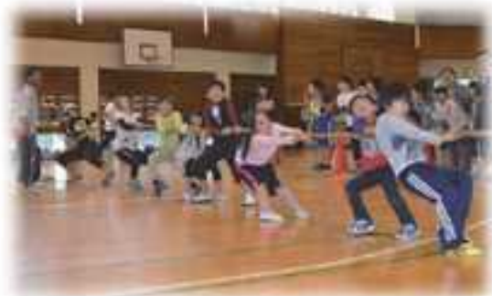
スポレク祭（綱引き）