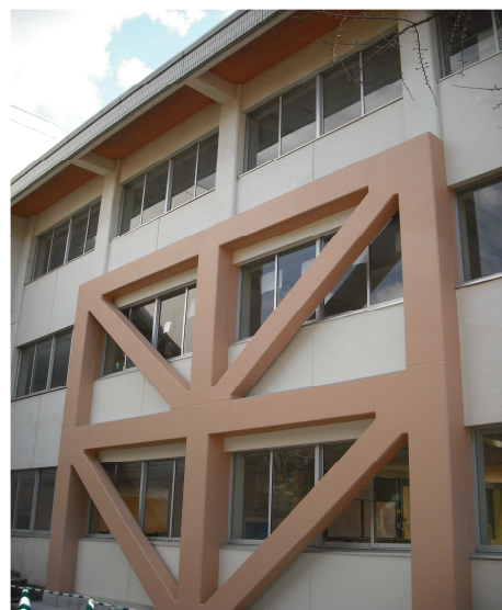
( 裏 庭 側 )

外壁に補強するピタコラム工法 (現場打ち鋼板内蔵コンクリート 工法)により、耐震補強された北 校舎