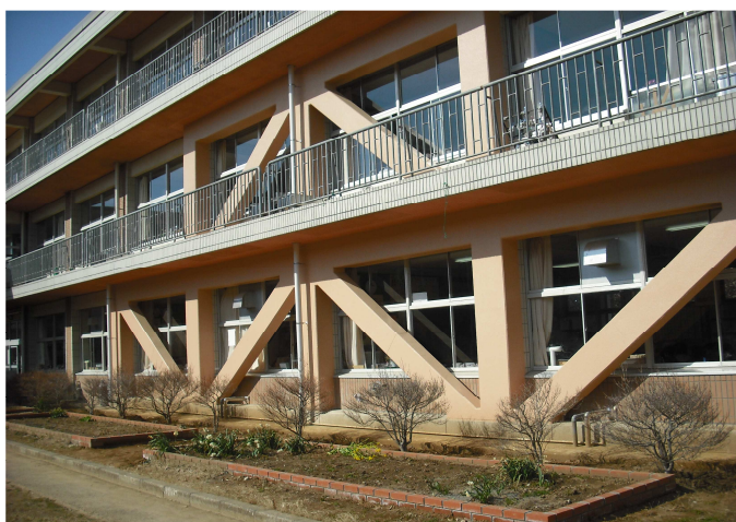
( 中 庭 側 )