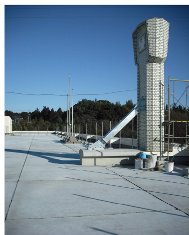
(1/31 撮影 大室台小学校)

酒々井中学校の普通教室棟と特別教室棟を結ぶ連絡通路の改修工事（左）と大室台小学校屋上防水工事（右）