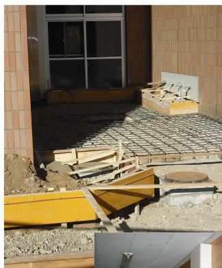
(1/31 撮影 酒々井小学校)