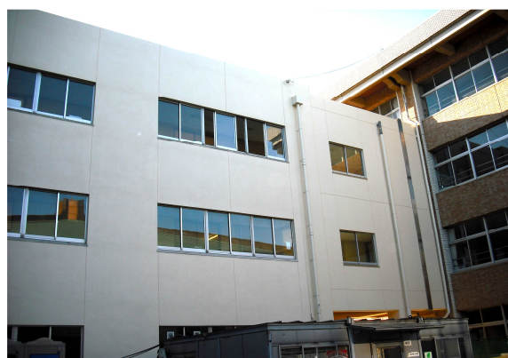
(1/31 撮影 酒々井中学校)

酒々井中学校の普通教室棟と特別教室棟を結ぶ連絡通路の改修工事（左）と大室台小学校屋上防水工事（右）