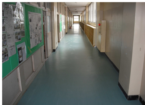
酒々井中校舎の廊下を改修しました。