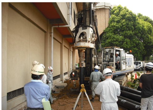
酒々井中体育館の杭打ち工事