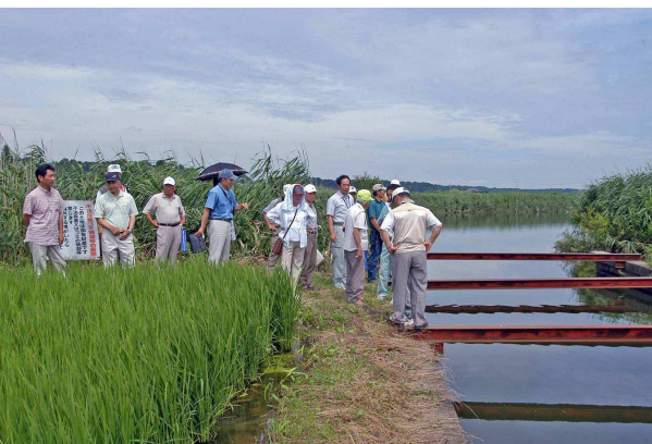
5 印旛沼低地排水路との合流部