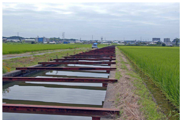
6 印旛沼低地排水路との合流部から上流を望む