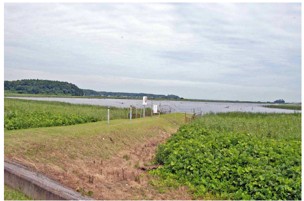
2 宗吾機場から印旛沼を望む