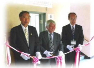
まちづくり研究所開設