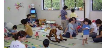
役場に設置 あいあいルーム