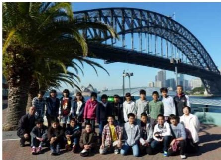
中学生オーストラリア派遣