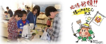
学校支援ボランティア