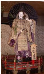
山草人形・小野道具