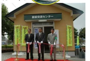
駅前交流センター