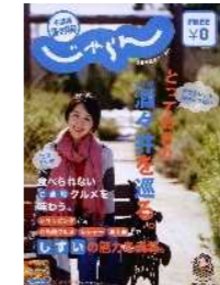
特別区全国連携プロジェクト 魅力発信イベント参加