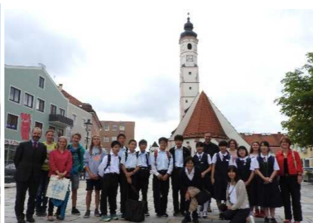
中学生ドイツ派遣