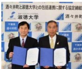
淑徳大学との連携協定