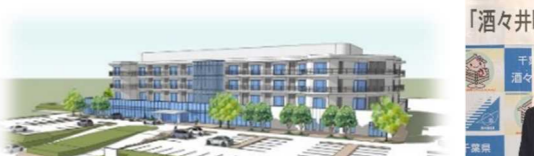
病院招致決定（H31.4 開院予定）

株式会社セブンイレブン・ジャパンとの 「酒々井町高齢者見守り活動等に関する協定」締結