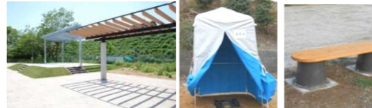
防災パーゴラ（テント取付可能休憩所）