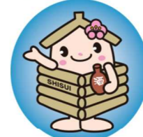
井戸っこ(しすいちゃん)