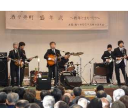
還暦を祝う盛年式