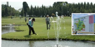
しすいの森パークゴルフ場