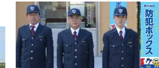
防犯ボックスセーフティアドバイザー