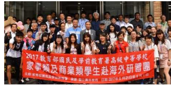
台湾教育旅行生ホームステイ