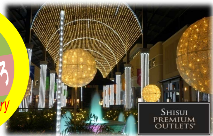
アウトレットのウィンターイルミネーション