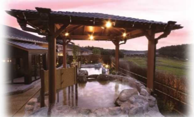
酒々井温泉「湯楽の里」