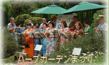
ハーブガーデンまつり