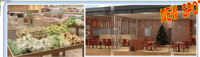
いずもマルシェ 産直市場・カフェ・天ぷら専門店など