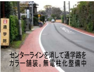
センターラインを消して通学路をカラー舗装。無電柱化整備中