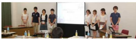
早大生からまちづくり提言