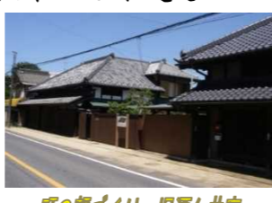
町の顔づくり 旧酒々井宿