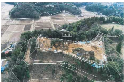
国指定史跡 本佐倉城跡 -続日本100名城に選定-