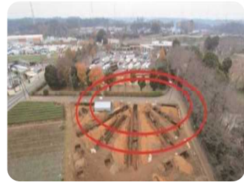
星古沢府ノ遺跡 約3万年前の日本最大級環状集落