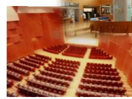
図書館・文化ホール複合施設 プリミエール酒々井