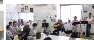
交流サロン「井戸端」