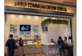
アウトレット内 コミュニケーションセンター